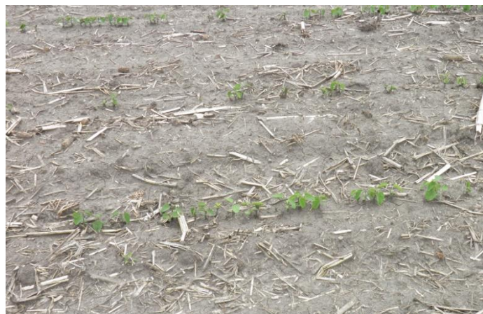
Piètre établissement du peuplement dans un champ de soya en raison des dommages causés par la mouche du maïs..