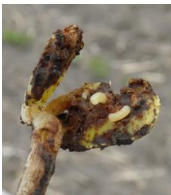
Mouche du maïs se nourrissant de cotylédons de soya.