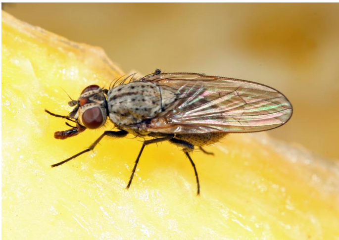
Mouche du maïs adulte.