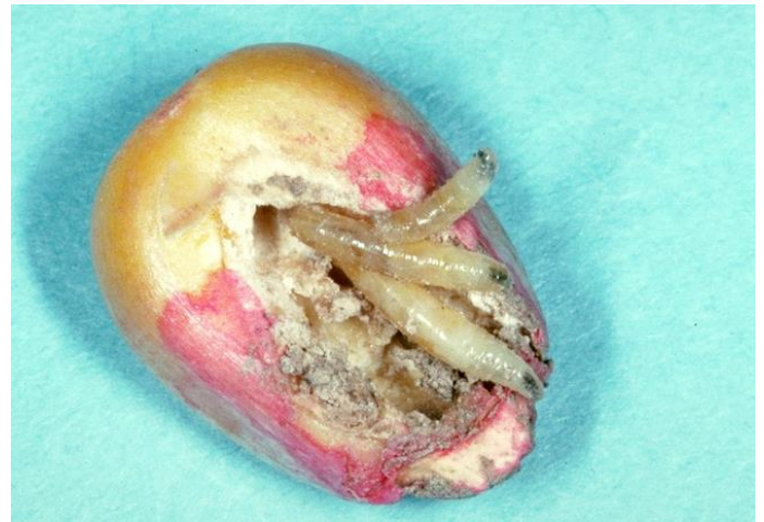
Larves de la mouche du maïs se nourrissant d'un grain de maïs.