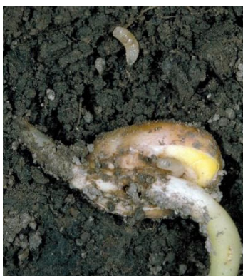
Larves matures de la mouche du maïs trouvées dans le sol.