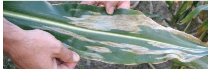
Lésions causées par l'helminthosporiose du Nord du maïs