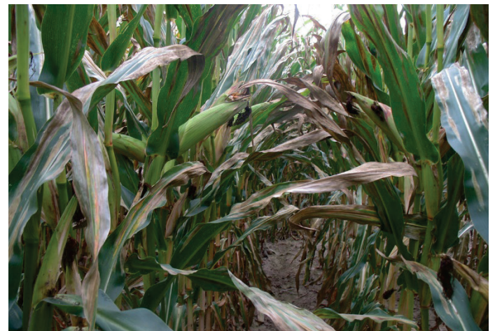
Feuilles de maïs avec de grandes lésions de la BS. Notez comment la couleur varie du gris-vert au brun pâle.