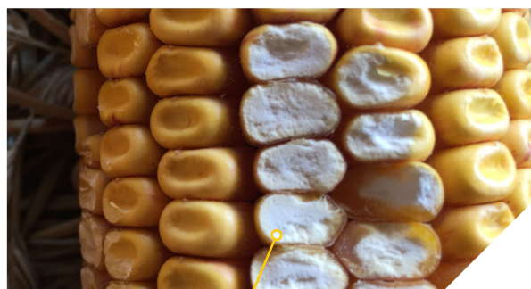
Grain denté farineux Pioneer