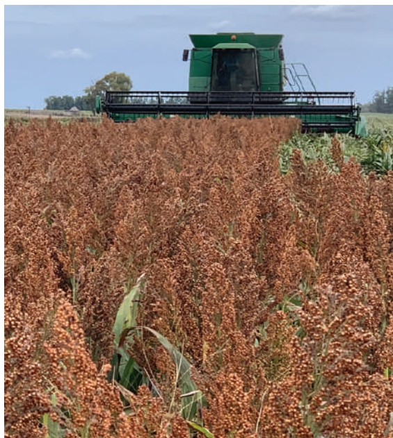
Cosecha de 84P68 en Tala, Canelones.