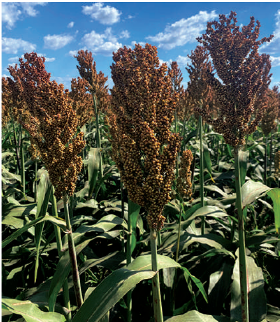
8419 de segunda en Río Negro.

Rendimiento y estabilidad de producción en todos los ambientes, es lo que distingue a este híbrido de excelente performance y muy sembrado en Uruguay. Ante la aparición de la problemática de pulgón amarillo ( Melanaphis sacchari ), fue el híbrido comercial de mejor comportamiento en el campo, destacándose frente a otros materiales de alta susceptibilidad. Su ciclo es intermedio – corto, tiene alto contenido de taninos, y buena excersión de panoja.