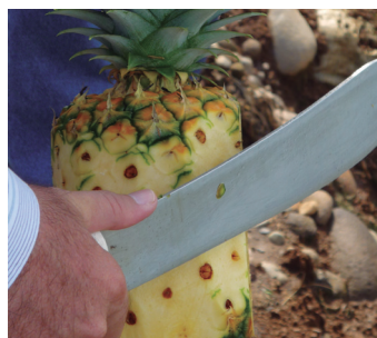
Protección con Intrepid™