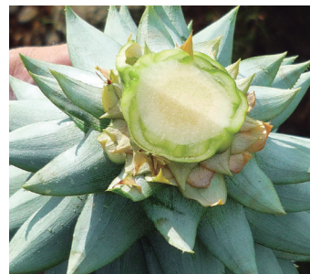
Protección con Entrust™ SC