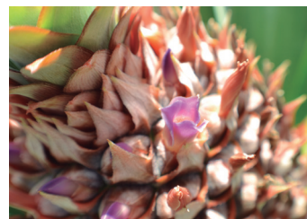
Protección con Exalt™ / Palgus™

Exalt® / Palgus® proporcionan un control residual sobre un amplio espectro de insectos plaga, a bajas dosis de uso.