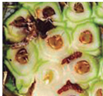
Barrenador del fruto

Intrepid™ imita la hormona natural de la muda del insecto, induciendo a las larvas a una muda prematura letal, encontrándose impedidas de deshacer su vieja cutícula por lo que mueren de deshidratación e inanición después de haber ingerido el tejido vegetal tratado con Intrepid™.