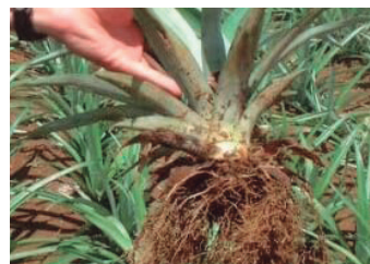
Protección con Vydate® CLV