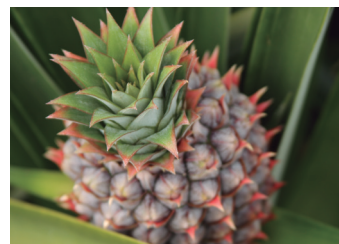
Protección con Spintor™12 sc