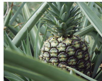
Protección con Galant™ Ultra