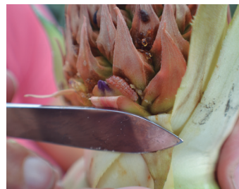
Barrenador del fruto

Spintor® 12 sc afecta el sistema nervioso de los insectos, actuando como activador de los receptores nicotínicos de la acetilcolina.