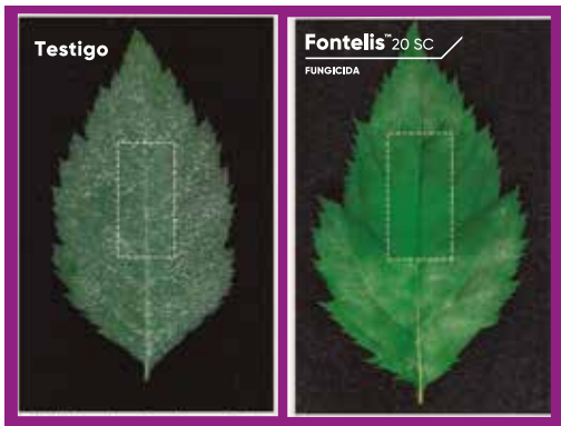
Aplicación realizada en el cuadro marcado y la inoculación de las esporas de la cenicilla polvorienta se realizaron en la base y la punta de la hoja

Movimiento sistémico local con propiedades curativas.