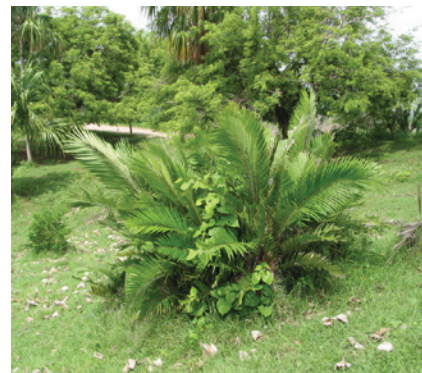
Palmacea Palma lata ( Bactris minor )