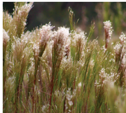
Gramínea Rabo de zorro ( Andropogon bicornis )