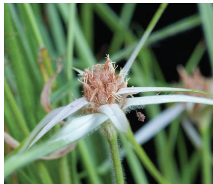
Ciperácea Estrellita blanca ( Dichromena ciliata )

En el grupo de hoja angosta encontramos las familias botánicas gramíneas, ciperáceas y palmáceas, entre otras.