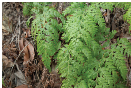
Maleza especial: Helecho ( Pteridium aquilinum ) familia hypolepydacea

Por último, el cuarto grupo de malezas presentes en potreros, el cual se denomina " especiales " debido a que no se pueden clasificar como mono o dicotiledónea; aquí encontramos a los helechos, que son plantas que no producen flores, frutos o semillas y se reproducen mediante esporas que se encuentran en el envés de las hojas. La muerte total en este tipo de malezas se da entre 60-120 días después del tratamiento herbicida.