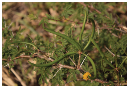
Maleza Leñosa: Aromo, Pelá, Huizache, Subinché ( Acacia farnesiana ) familia fabáceas

El tercer tipo son las Leñosas , cuyos tallos presentan una coloración café durante la mayor parte de su ciclo de vida y difícilmente se quiebran. Por lo general son arbustivas, como su nombre lo indica, llegan a convertirse en arbustos o árboles, de muy difícil control por parte de los herbicidas. En muchos casos no se pueden controlar por vía foliar, requiriendo la aplicación al tocón para poder eliminarlas de raíz. La muerte radicular en este tipo de malezas se da entre 90-180 días después del tratamiento herbicida.