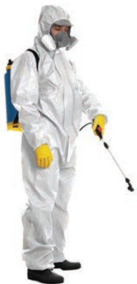
Equipo de Protección Personal (EPP)

La limpieza adecuada del equipo garantiza la salud de los aplicadores, la preservación de la naturaleza y la efectividad del herbicida. Debe hacerse diariamente, al final del uso y al cambiar el tipo de producto, siempre con el Equipo de Protección Personal (EPP) apropiado . Se pueden usar detergentes especiales, desengrasantes y otros productos además del agua.