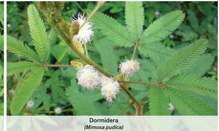
Dormidera ( Mimosa pudica )