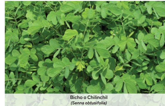
Bicho o Chilinchil ( Senna obtusifolia )