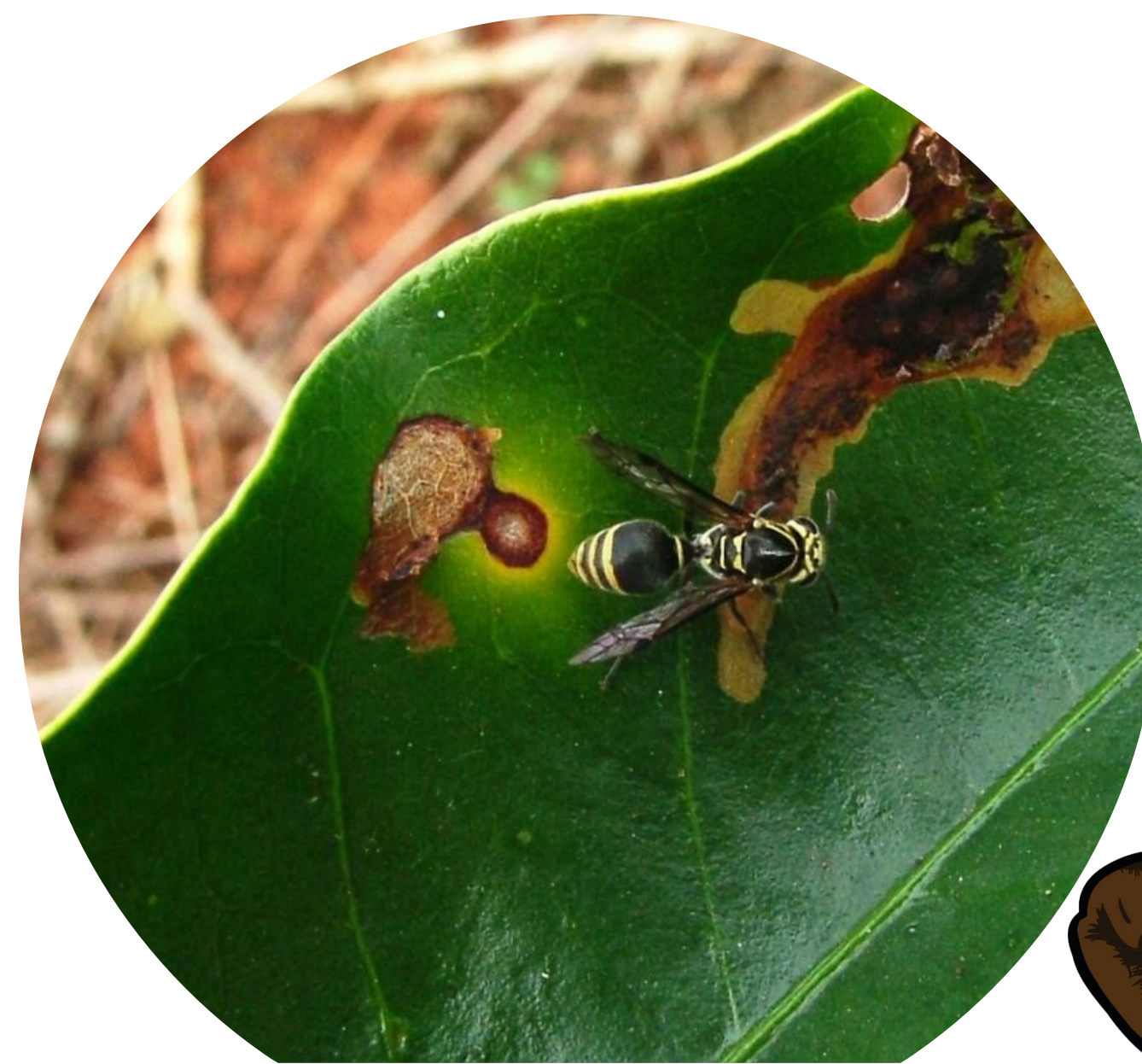
Polistes versicolor – (Inimigo natural do bicho-mineiro)