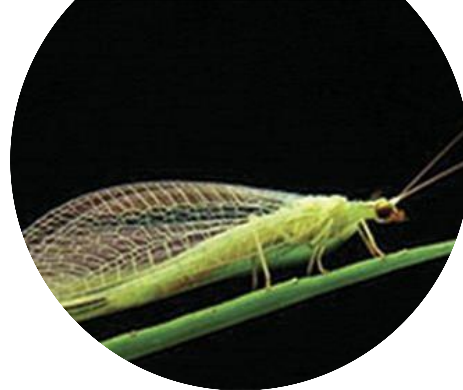
Crysoperla Externa – (Inimigo natural do bicho-mineiro)

Outro ponto importante a se observar na aplicação dos inseticidas utilizados para o controle da broca-do-cafeeiro ( Hypothenemus hampei ) é que muitos produtores estão realizando sucessivas aplicações de produtos não seletivos e extremamente agressivos, devido a seu baixo custo e efeito de choque, porém essa prática pode resultar em sérios desequilíbrios para a cultura. Uma estratégia interessante para a preservação dos insetos benéficos é a preferência pela aplicação de inseticidas seletivos, assim como o Revolux ® para bicho-mineiro e Tracer ® para a broca-do-café.