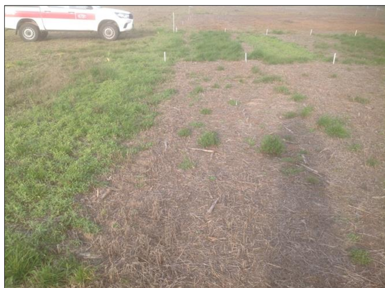
LOLMU control: Rimsulfuron 150 g/ha + glifosato 1300 g/ha. 90 DDA. Armstrong (Sta. Fe) 2017.

Todos los tratamientos con rimsulfuron presentaron un buen control de LOLMU y ERISU, con niveles superiores al 80 % luego de los 100 días después de la aplicación (DDA). Como resultado de su modo de acción y las características propias de esta molécula en cuanto a la relación con los factores ambientales (fundamentalmente temperatura, lluvia, humedad y pH del suelo) el tratamiento de rimsulfuron a 150 g/ha mostró un incremento de control más lento que el de los otros tratamientos, llegando a su máximo valor a los 85 DDA en el caso de LOLMU, y de 65 DDA en el de ERISU.