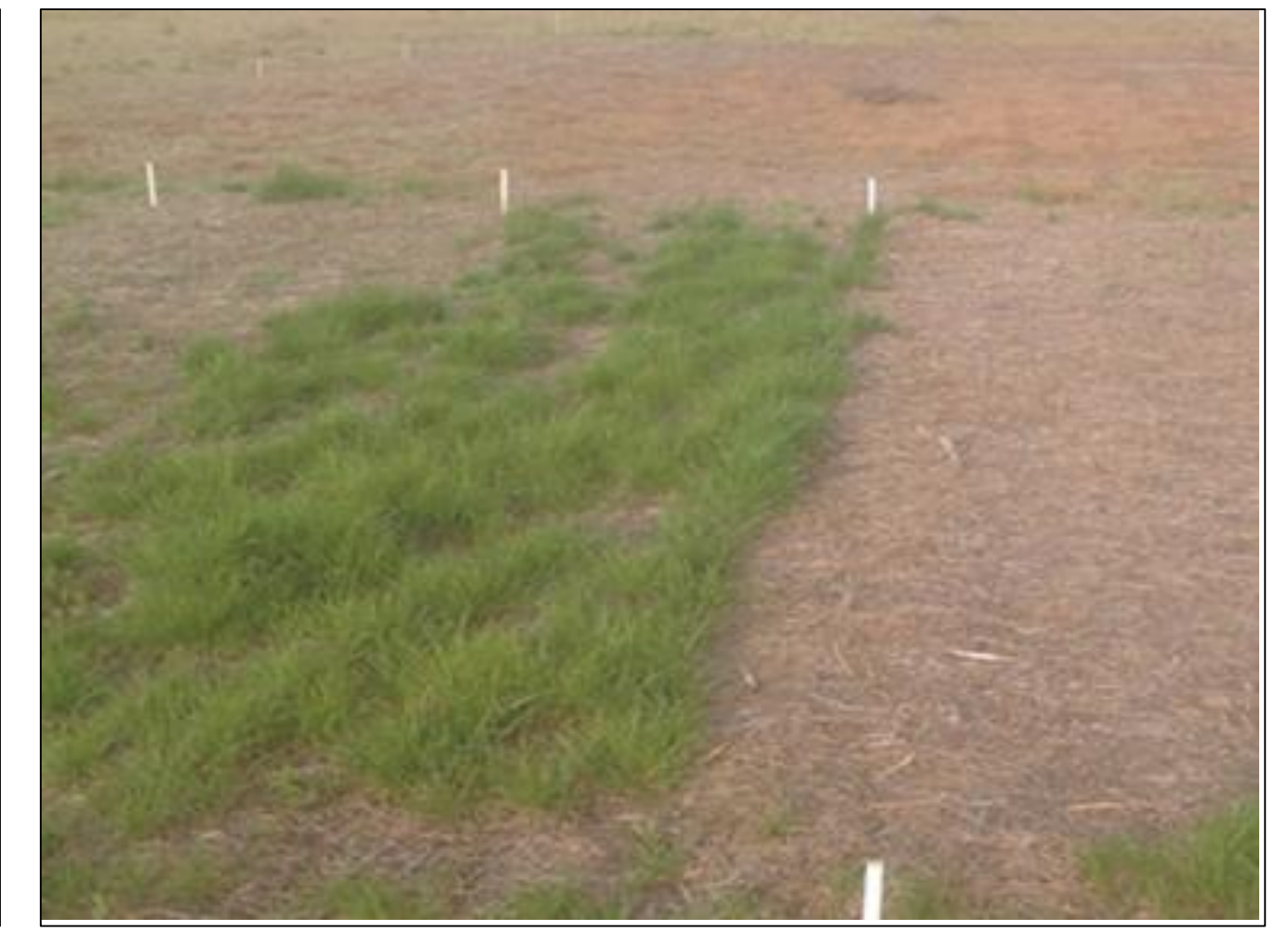
LOLMU control: glifosato 1300 g/ha. 90 DDA. Armstrong (Sta. Fe) 2017.

Los tratamientos con acetoclor y S-metolaclor permitieron lograr valores de control superiores al 80% más rápidamente, siendo el tratamiento de rimsulfuron con S-metolaclor, el que mostró la mayor rapidez y persistencia en el control de LOLMU. Para el caso de ERISU, si bien este tratamiento mostró mayor rapidez, no se presentaron diferencias en cuanto a niveles y persistencia de control en relación al tratamiento con rimsulfuron a 150 g/ha y a rimsulfuron con acetoclor.