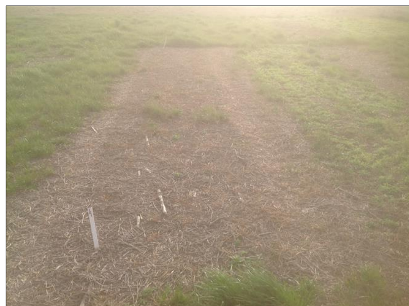
LOLMU control: Rimsulfuron 100 g/ha + acetoclor 2000 ml/ha + glifosato 1300 g/ha. 90 DDA. Armstrong (Sta. Fe) 2017.