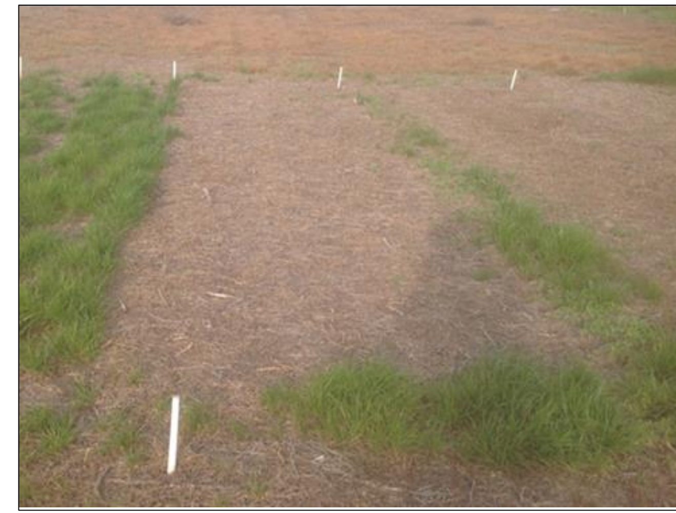
LOLMU control: Rimsulfuron 100 g/ha + S-metolaclor 1000 ml/ha + glifosato 1300 g/ha. 90 DDA. Armstrong (Sta. Fe) 2017.