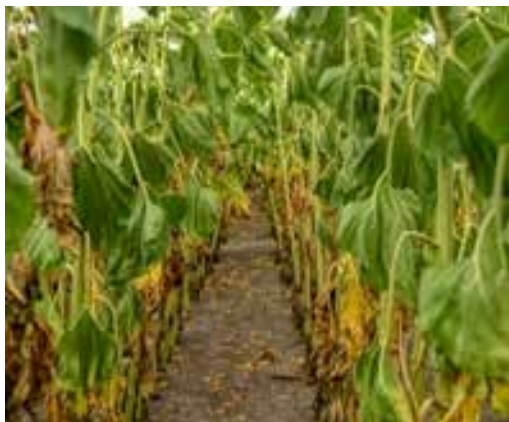
Танос®, 0,6 кг/га*

* Демоділянка, оброблена фунгіцидом Танос® у фазу 8 листків, Київська обл., с Велика Каратувль, 2018 р.