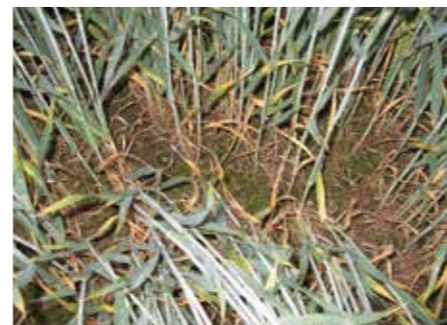
Sikta mot stjärnorna när du vill bekämpa gräs- och örtogräs effektivt!

Broadway Star är registrerad för användning på våren och är effektiv tidigt på våren så fort ogräsen befinner sig i aktiv tillväxt. Denna möjliga tidiga behandlingstidpunkt ger den bästa effekten på alla ogräs och säkrar därmed optimal konkurrensförmåga åt grödan.