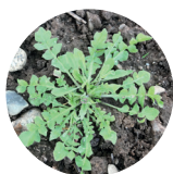
Crucifères (stade jeune)