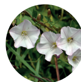
Liseron des haies