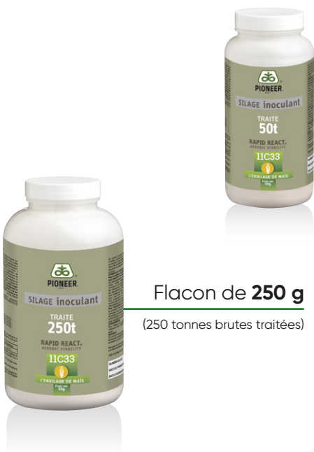
Flacon de 50 g (50 tonnes brutes traitées)