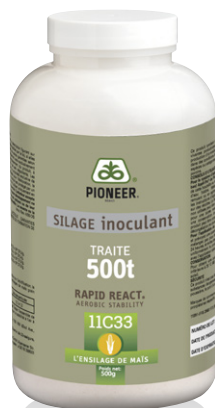
Flacon de 500 g* (500 tonnes brutes traitées)