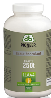
Flacon de 250 g (250 tonnes brutes traitées)