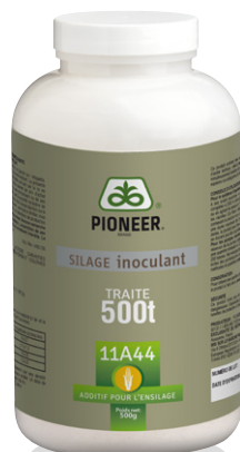
Flacon de 500 g* (500 tonnes brutes traitées)