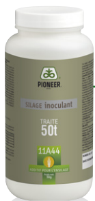
Flacon de 50 g (50 tonnes brutes traitées)