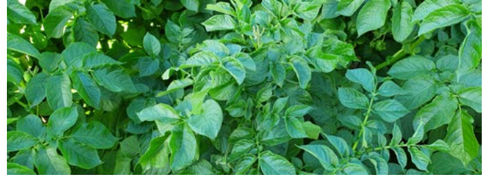
ZORVEC ENICADE® & ENDAVIA™ BLOK VAN 3 ELKE 10 DAGEN