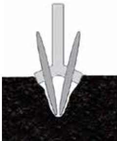
Opening van de zaairij