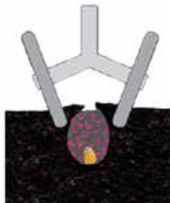
Volledige sluiting van de zaairij