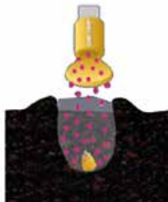
Leggen van het zaad + microgranulaat