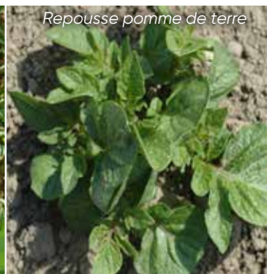
Repousse pomme de terre