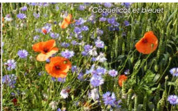
Coquelicot et bleuet