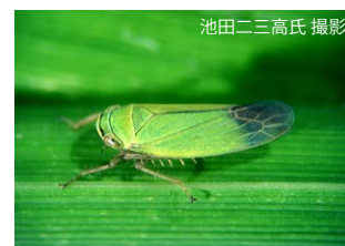
ツマグロヨコバイ